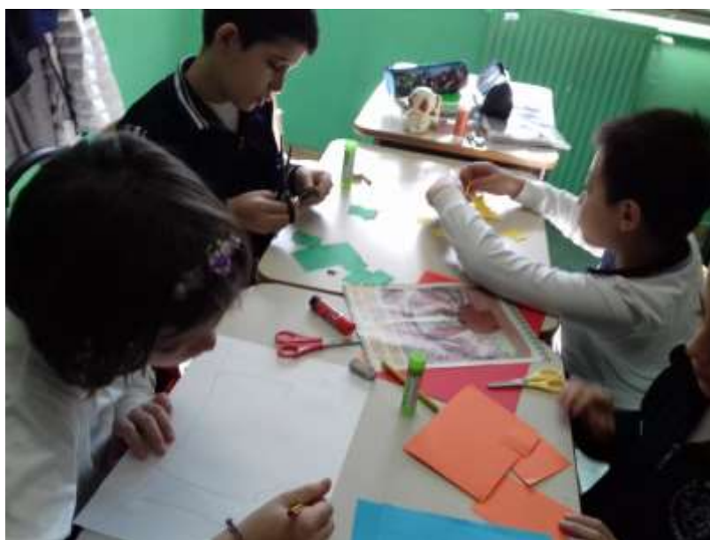
Collage ed elaborati grafico-pittorici