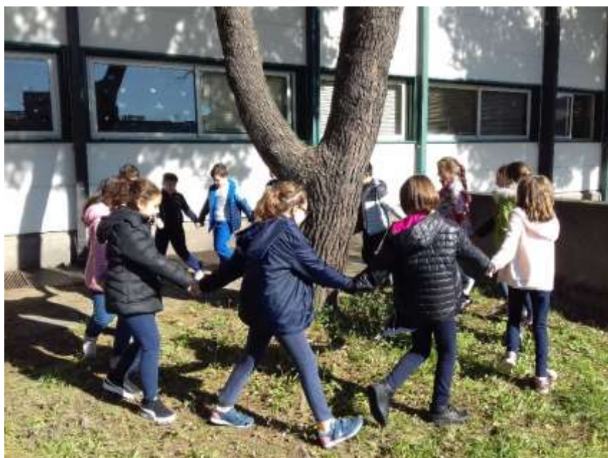
Girotondo e canzone "Siamo tutti alberelli"