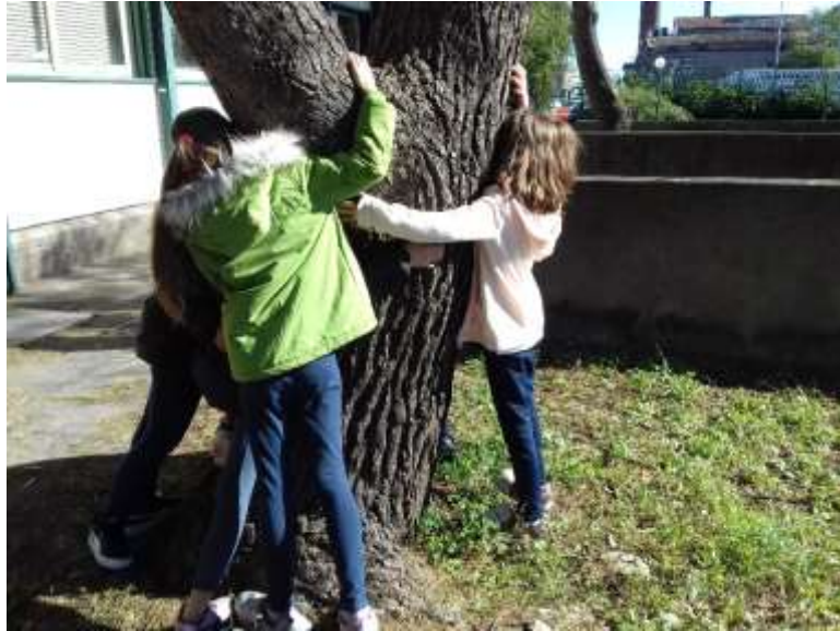
Abbracciamo gli alberi...